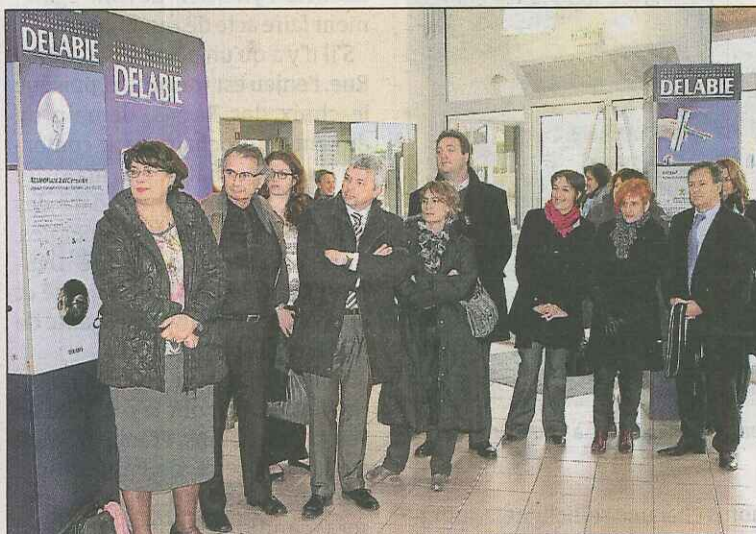
Lors de l'inauguration effectuée en présence d'Yves Delécluse, directeur académique des services de l'Éducation nationale, et d'Annie-Claude Leuliette, conseillère régionale.

La série d'expositions au lycée a également pour but de promouvoir les métiers de l'industrie dans un bassin d'emploi où celle-ci assure la moitié des embauches. La désaffection des jeunes pour ce domaine