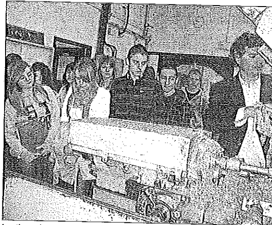
Les élèves des collèges de Feuquières-en-Vimeu et Friville-Escarbotin connaissent désormais les secrets de fabrication des robinets Delabie.